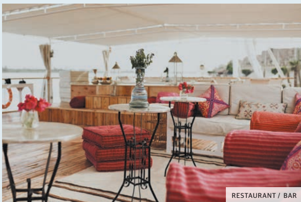
RESTAURANT / BAR